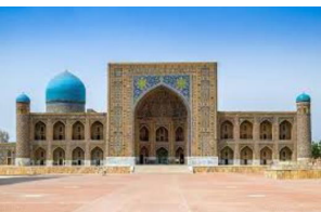
C) Tilla Kari Medresesi